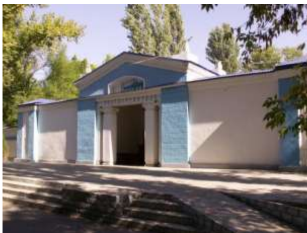
Летний кинотеатр «Гидростроитель»

Далее по улице Карла Маркса парк культуры и отдыха «Гидростроитель». Здесь со стороны улицы К. Маркса, был тогда главный вход в парк, потому что основная масса строителей проживала в литерных кварталах.