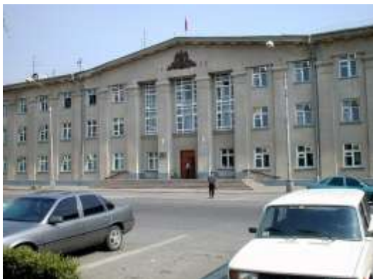
Здание администрации городского округа – город Волжский

Еще раньше в 1956 году, на проспекте Ленина, 28, построено первое в СССР здание из керамзитобетона (бывший книжный магазин, теперь столовая «Свои люди»). Обязательные атрибуты каждого города – Главпочтамт и Госбанк (проспект Ленина, 33).