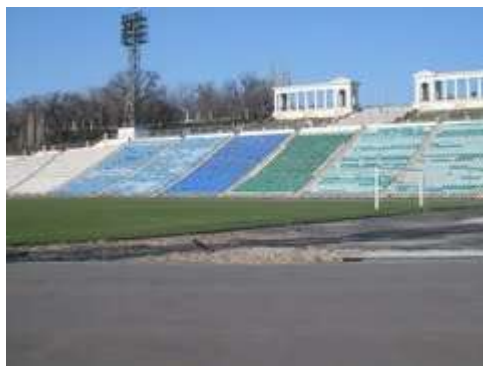
Центральный стадион им. Ф. Г. Логинова