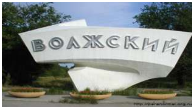
Въездной знак, автор П. Л. Малков

Любовь к большой России начинается прежде всего с любви к своей малой родине. Краеведение сегодня – это многоаспектная работа библиотекарей в тесном контакте друг с другом, а также со специалистами и знатоками региона по исследованию и всестороннему раскрытию сведений об истории и культуре родного края. Интерес к краеведческой теме был и будет всегда. Краеведение играет огромную роль в деле патриотического воспитания, оно неопределимо в приобщении к миру красоты и добра, в воспитании хорошего вкуса, высоких норм поведения в обществе. Живя в современном обществе, мы не должны забывать об истории родного народа, его истоках, богатых традициях, обычаях. Нас окружают прекрасные исторические места, памятники архитектуры, музеи.