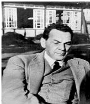
Герой СССР Рихард Зорге

Парк «Гидростроитель» замыкает огромный Дворец культуры. Он строился по театральному проекту и является воплощением настоящего Большого театра. Вполне естественно, что в 1954 году улицу, примыкающую к парку и дворцу называли Театральной., а площадь – Дворцовой.