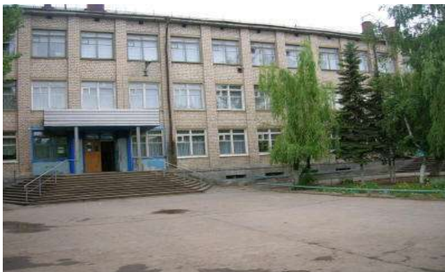
МБОУ Средняя школа № 13