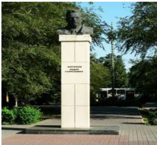
Памятник Логинову Ф. Г. Автор скульпторы П. Л. Малков