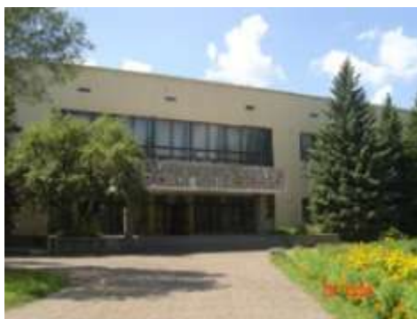
Дворец творчества детей и молодежи

Продолжает улицу Дворец творчества детей и молодежи (бывший Дворец пионеров). В 1967 году Дворец был построен.