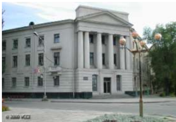
Здание управления «Волгоградгидростроя»

Проспект Ленина, 2 – здание управления «Волгоградгидростроя» (1953). На нем мемориальная доска в память о первом начальнике Федоре Георгиевиче Логинове и памятник ему как основателю города.