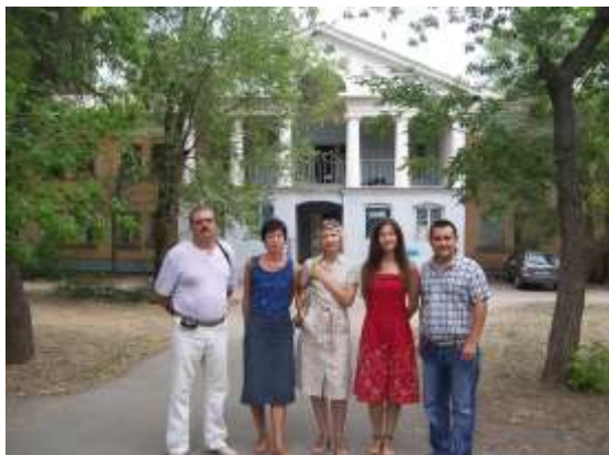
Редакция газеты «Волжская правда»