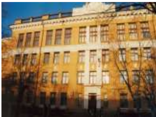
Средняя школа № 2