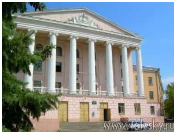
Волжский политехнический техникум

И снова мы идем по городу. При въезде в Волжский нас встречает памятник первостроителю № 1 Федору Георгиевичу Логинову – первому начальнику строительства Сталинградской ГЭС. Он установлен на самом историческом месте для нас, волжан, на площади Строителей, рядом с управлением строительства Сталинградской гидроэлектростанции. Здание построено в 1953 году и является историко-архитектурным памятником. У входа в здание – мемориальная доска, свидетельствующая об этом событии.