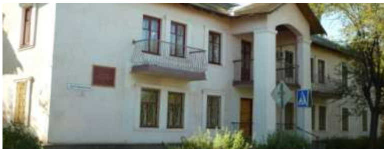
Детская музыкальная школа №2