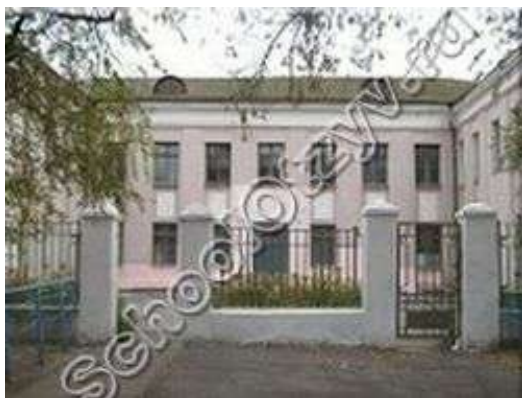
МУОШ № 10

Керамзитобетон позволял удешевить, облегчить, а главное, ускорить строительство жилья в молодом городе. Разработкой новых домов из керамзитобетонных блоков занималась проектно-конструкторская контора Сталинградгидростроя, впоследствии Всесоюзный проектный институт «Энергожилиндустрпроект».